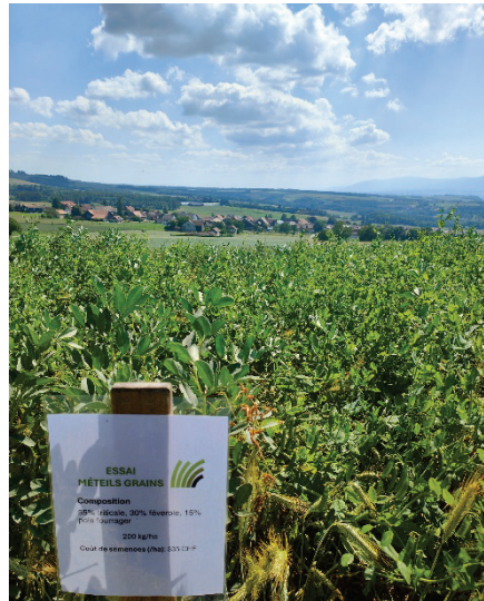
TFP 2 : 55% triticale, 30% féverole d'hiver, 15% pois fourrager d'hiver, 200 kg/ha