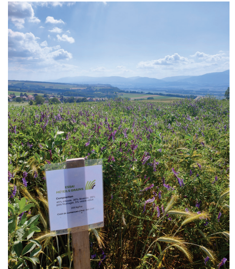
TFPV : 45% triticale, 30% féverole d'hiver, 20% pois fourrager, 5% vesce velue, 200 kg/ha (seulement Pomy)