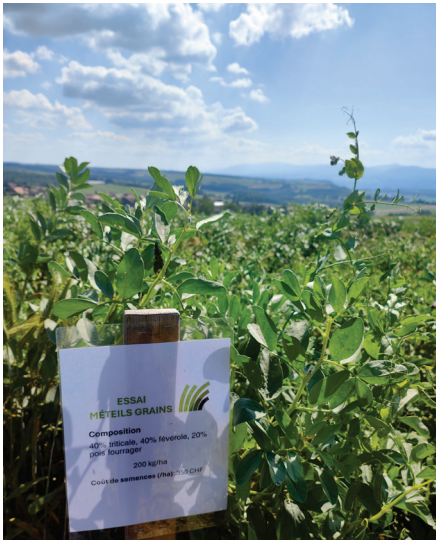
TFP : 40% triticale, 40% féverole d'hiver, 20% pois fourrager d'hiver, 200 kg/ha